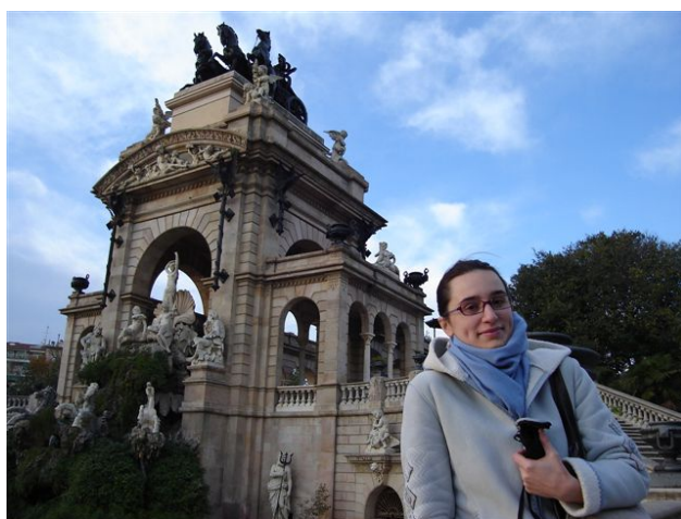
Jedan od najljepših parkova u Barseloni.