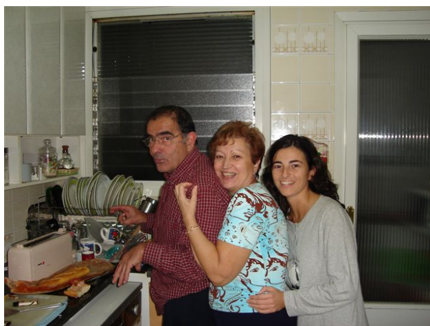
Moja porodica u Barceloni! Predivni i preslatki!